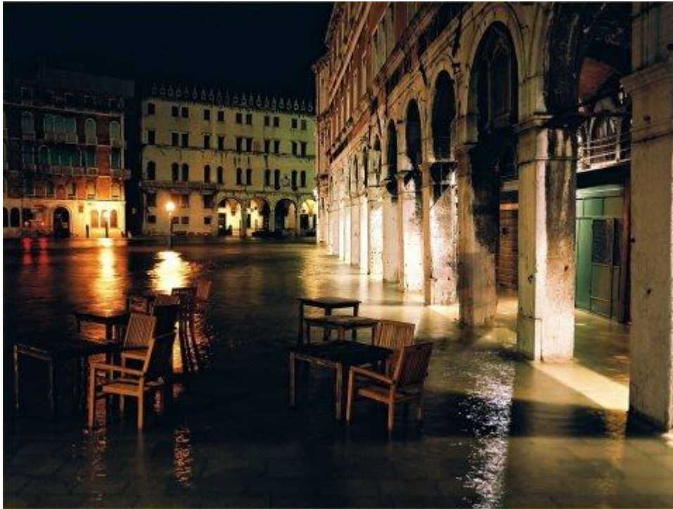
Acqua Alta (Hochwasser) in Venedig.