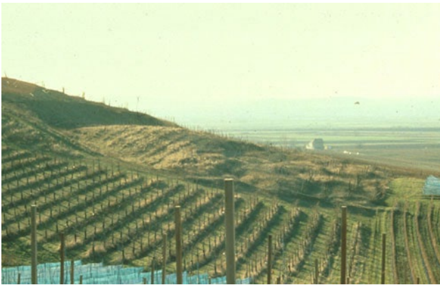
■ Abb. 12.3 Rotationsrutschung bei Ockenheim, Rheinhessen.

(Papathoma-Köhle und Glade 2013), wie die Geländeoberfläche geformt ist, wie stark der Boden verwittert ist, welches Gestein ansteht und wie viel Material und Wasser verfügbar sind. Die gleiche Niederschlagsmenge kann also mal Rutschungen auslösen und mal nicht – je nach Situation am Hang.