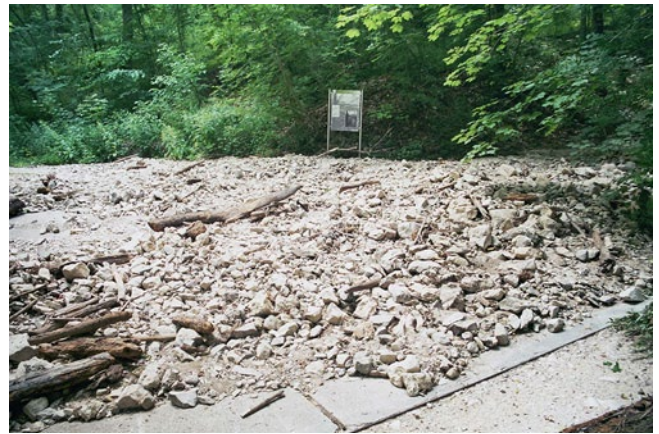
■ Abb. 12.2 Murablagerung in Bad Überkingen, Schwäbische Alb. (Rainer Bell)

Muren sind Ströme aus Wasser, Schlamm- und Gesteinsmassen, die sich im Gebirge bergabwärts bewegen (■ Abb. 12.2). Die kli-