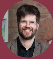
» Jan Steckel Mercator Research Institute on Global Commons and Climate Change