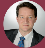
» Benjamin Görlach Ecologic Institute