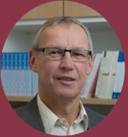
» Ulrich Fahl Universität Stuttgart –Institut für Energiewirtschaft und Rationelle Energie-anwendung