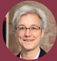
» Dr. Brigitte Knopf Mercator Research Institute on Global Commons and Climate Change