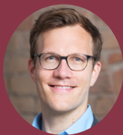
» Falko Leukhardt Mercator Research Institute on Global Commons and Climate Change